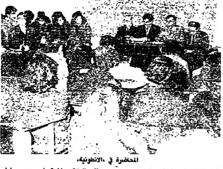
المخاضة في الانطونية.